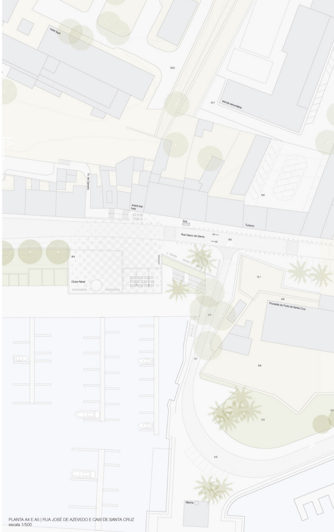
PLANTA A4 E A5 | RUA JOSÉ DE AZEVEDO E CAIS DE SANTA CRUZ escala 1/500